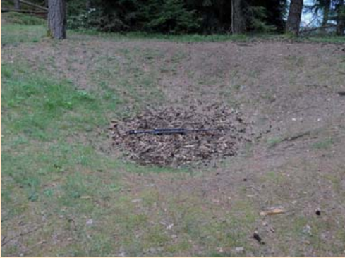
Pinge im Bergwerksgebiet von Pfunders-Villanders